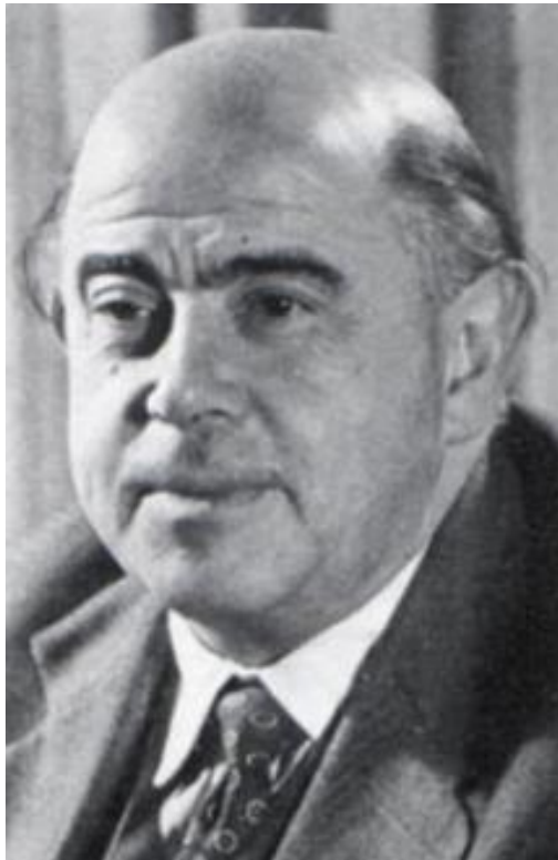
Nicholas Kaldor 1908-1986